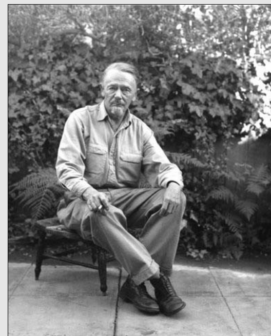
Ovan Clark Ashton Smith sista åren i livet (foto taget omkr. 1960). T.v. en illustration av fantastik-konstnären J.K. Potter till boken Morthylla , en samling dark fantasy-noveller av Smith.